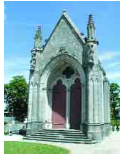
Le Lieutenant-Général Comte Charbonnel et deux bâtiments que nous lui devons : l'asile Charbonnel et la chapelle Saint-Charles

modifications furent apportées, comme le creusement, en 1855, avec le secours financier de l'État, d'un puits, par souci d'hygiène, dans la cour de l'asile... mais craintes de Monsieur le curé de l'époque, polémiques : attention à ne pas compromettre la solidité de l'église avec les charges d'explosifs utilisés !