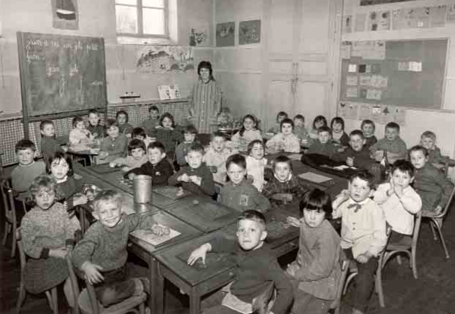
Classe de maternelle, 1963-64