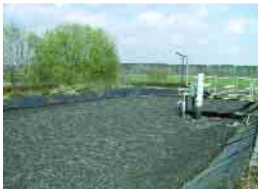
Le traitement actuel des boues

La maçonnerie du bassin d'aération n'est pas en bon état. Des fissures importantes sont visibles sur la partie au-dessus du sol et laissent présager un vieillissement prématuré.