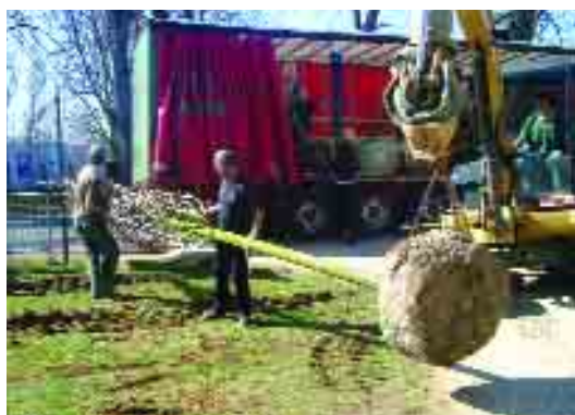
Le déchargement des arbres

La rue Gambetta est en cours de rénovation, en application de l'étude d'urbanisme confiée aux architectes Boyer et Maniaque, qui assurent la maîtrise d'œuvre des travaux.