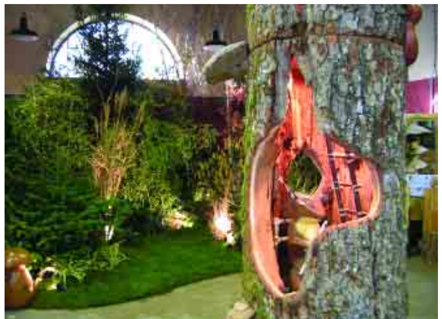
Exposition : l'arbre en milieu forestier, en milieu urbain

1 L'élagage excessif. 2 Les travaux de voirie, qui mutilent les racines. 3 L'usage du sel de déneigement. 4 Les polluants atmosphériques, plomb dans le supercarburant, poussières, aérosols, ... 5 Le stationnement des voitures trop près des troncs, qui a pour effet de tasser le sol. 6 L'asphalte tout autour du tronc, qui imperméabilise le sol et prive l'arbre de l'eau de pluie. 7 Les blessures dans l'écorce, le plus souvent provoquées par les automobiles. Il n'est pas facile d'agir sur toutes ces causes à la fois. Pour éviter l'élagage drastique (comme notre commune l'a connu par le passé), il faut planter des arbres adaptés par leur taille adulte à leur environnement urbain. C'est la philosophie qui a prévalu dans l'aménagement de la rue Gambetta.