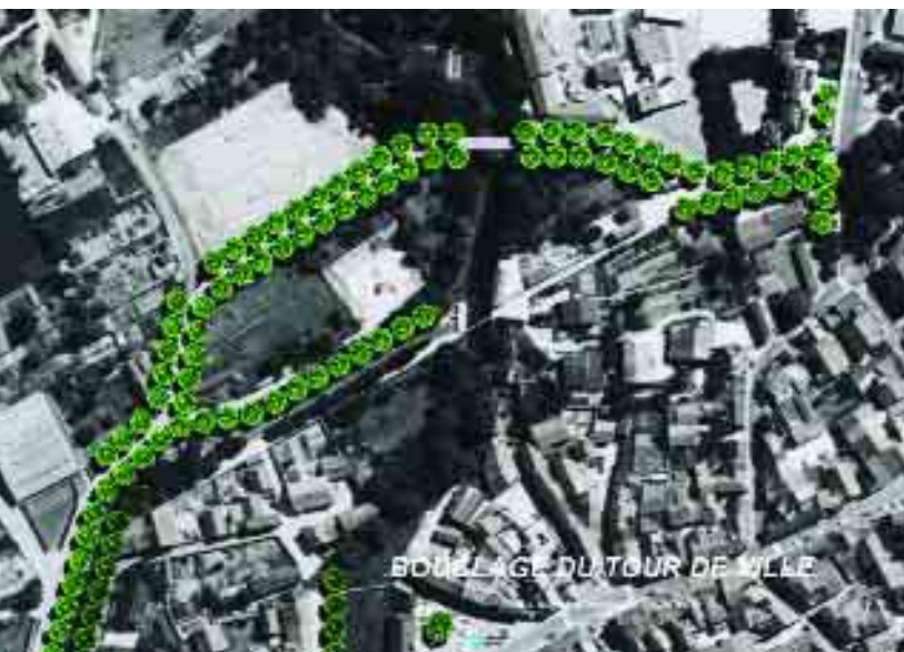
Un franchissement de l'Ignon permettrait de relier l'avenue Carnot au quartier nord et la route de Châtillon

muraille qui est le seul vestige encore entier du rempart de la ville.