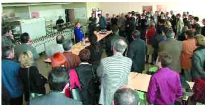
Toujours une forte présence des entrepreneurs locaux au forum des métiers au collège. Ici en avril 2003.