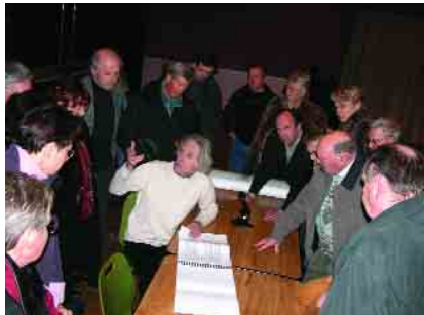
Présentation publique de l'étude le 19 février

d'équipements coûteux. La plantation d'arbres d'alignement suffirait le plus souvent à révéler le périmètre du cœur de ville historique tout en assurant une transition harmonieuse avec son environnement immédiat. Dans la rue Anatole France par exemple, des arbres taillés au port moyen répondraient aux sujets imposants présents de l'autre côté de la voie, dans le parc du château. Plus loin, de grandes formes libres feraient face au cimetière et à la haute