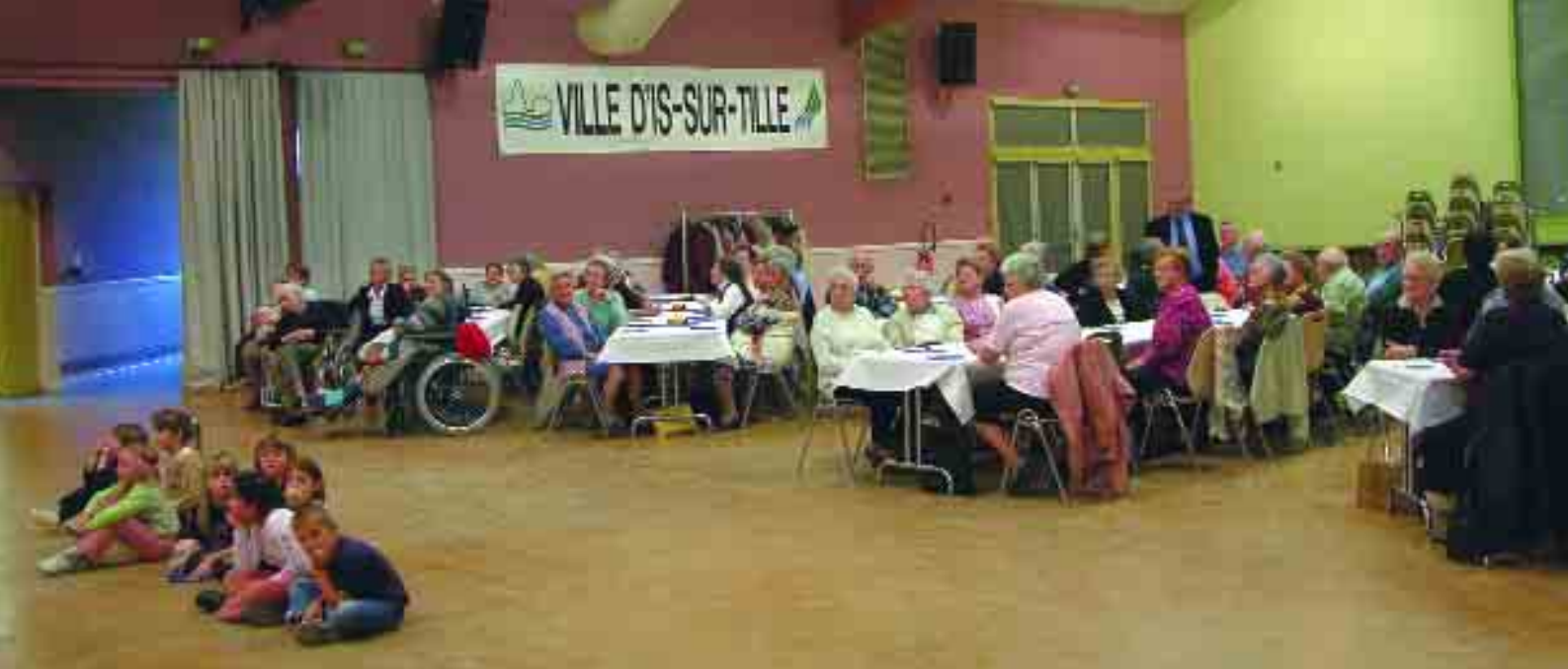
Renforcer les liens sociaux : la Semaine bleue