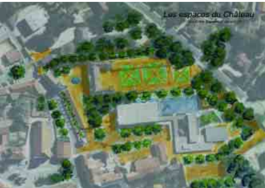
Un jardin à la française de conception contemporaine, une cour d'honneur, des cheminements matérialisés par les arbres, un front paysager à l'anglaise.

Après avoir déplacé la cour de récréation de l'école en direction de la rue Anatole France, l'espace serait libre pour accueillir un parterre symétrique à la française, sur un carton d'inspiration contemporaine.