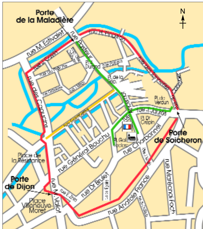
— anciennes fortifications — axes de développement de la ville

Et le visiteur moderne de la ville avoue qu'il s'y perd un peu. Les sens imposés à la circulation automobile n'ont guère arrangé les choses. La traversée d'Is-sur-Tille en voiture contourne la place principale, permettant seulement d'effleurer du regard l'église et la mairie, au lieu de conduire résolument à ce lieu central, au style architectural affirmé.